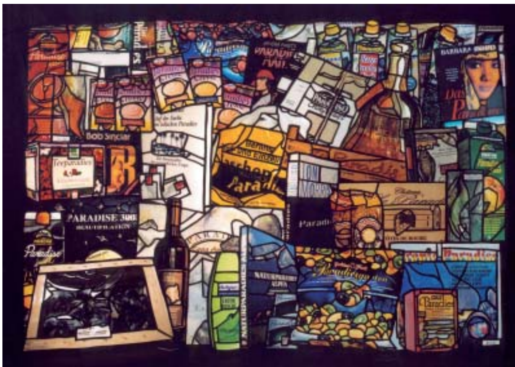
unten: Himmlich 2003 | 190 x 140 cm | Acrylfarbe und Collage auf Papier