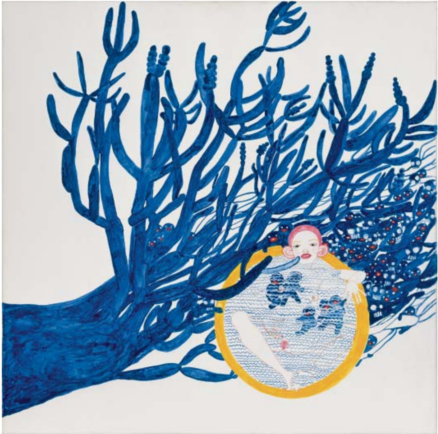
Love is blue 2005 | 70 x 70 cm | Aquarell auf Leinwand