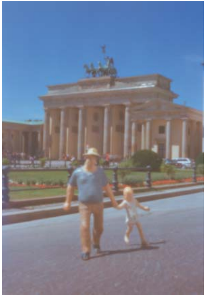
Aus der Serie: Grüße aus Berlin 2005 | je 30 x 20 cm | C-Prints