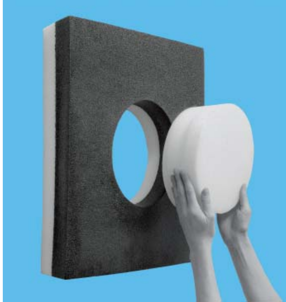
Kein Ziel / No aim 2005 | 65 x 60 cm | Fotografie, digital bearbeitet