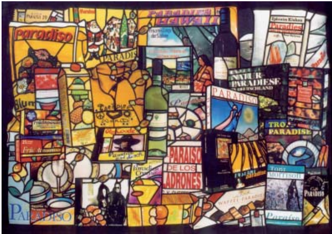
oben: Hölle-01/03 2004 | 74 x 104 x 20 cm | Fotografie auf Duratrans, Fotokarton, Neonröhre