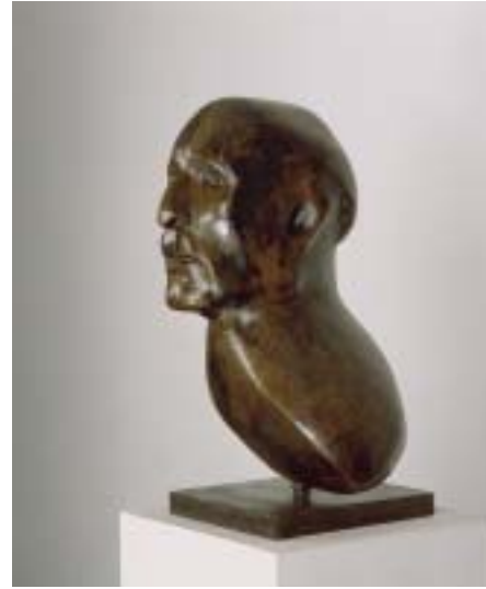
Bernhard Heiliger Kopf Carl Hofer 1951 | Höhe 44 cm | Bronze

Vorsitzender des Vorstandes der Karl Hofer Gesellschaft