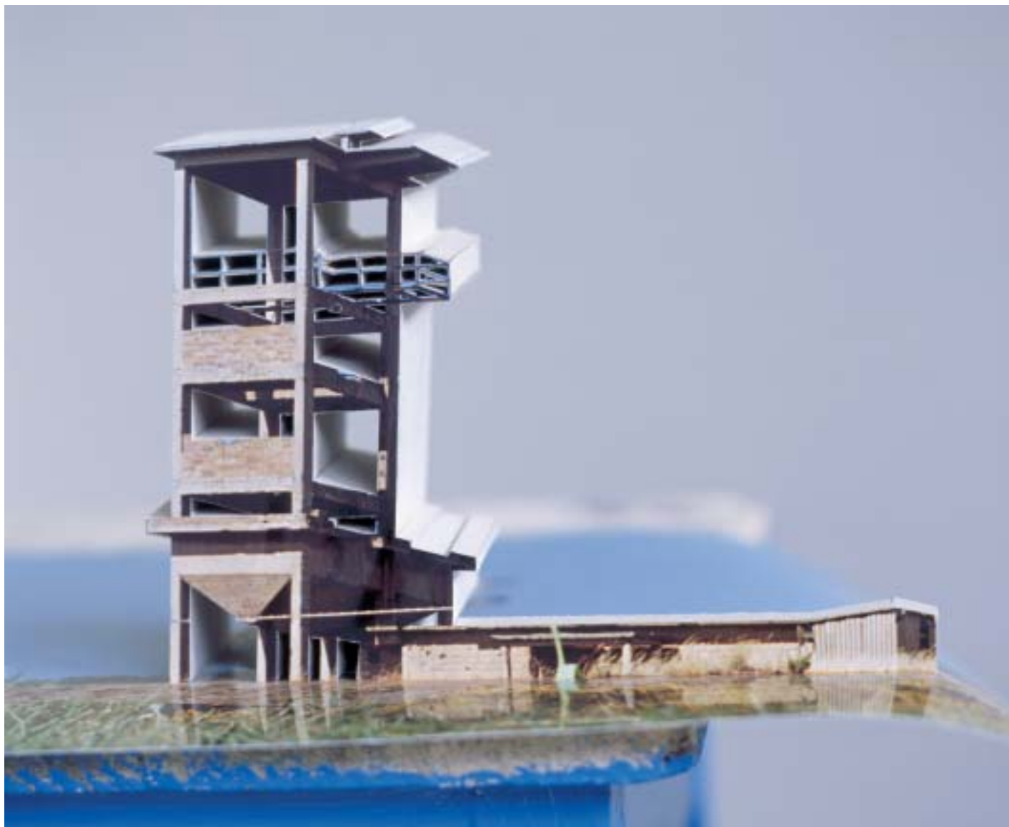
Piombino 2005 | 170 x 120 x 135 cm | Fotografie, Pappe, Glas, Metall, Beton