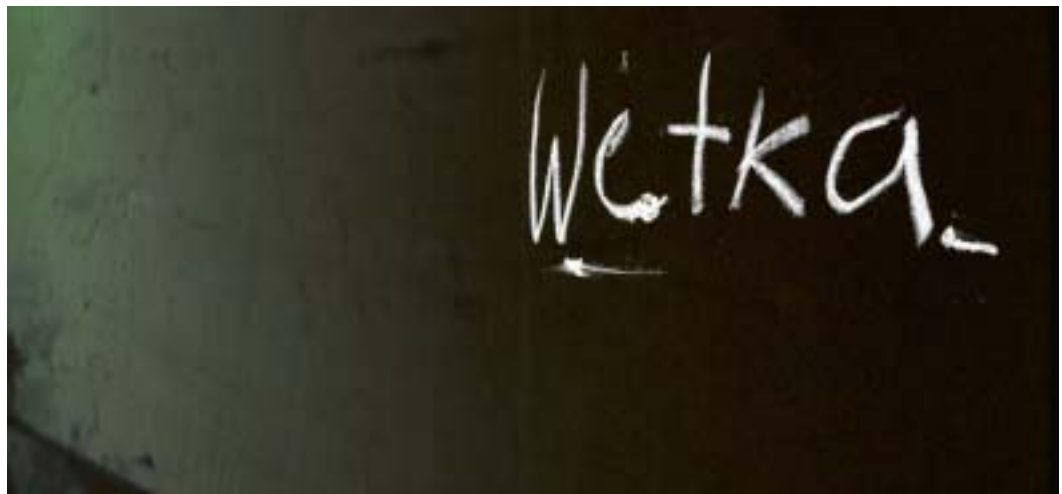
Wetka 2004 | Kurzfilm (35 mm) | Nach einer Geschichte aus dem Buch „Die Schule der Dummen“, Erstes Kapitel, von Sascha Sokolov